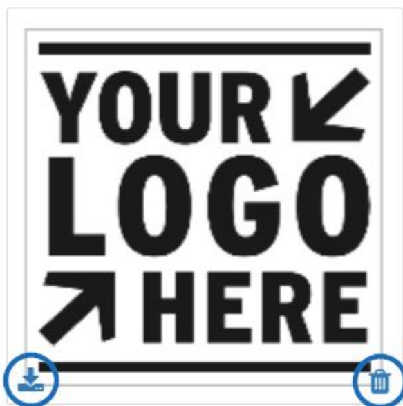
Your Logo Here.png

Para cargar una imagen o archivo adicional, haga clic en el botón Cargar, examine su computadora, seleccione la imagen y, a continuación, haga clic en Abrir. Todas las imágenes cargadas en esta sección estarán disponibles en la sección desplegable Ilustraciones y archivos de la pestaña Decoración al crear pedidos para este cliente.